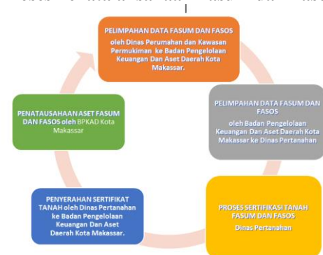
Gambar 2 Proses Penatalaksanaan Fasum dan Fasos

Adapun mekanisme sertifikasi tanah fasum dan fasos secara detail dapat dilihat pada gambar