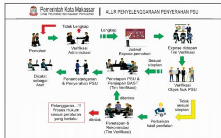
Gambar 1 Alur Penyelenggaraan Penyerahan PSU